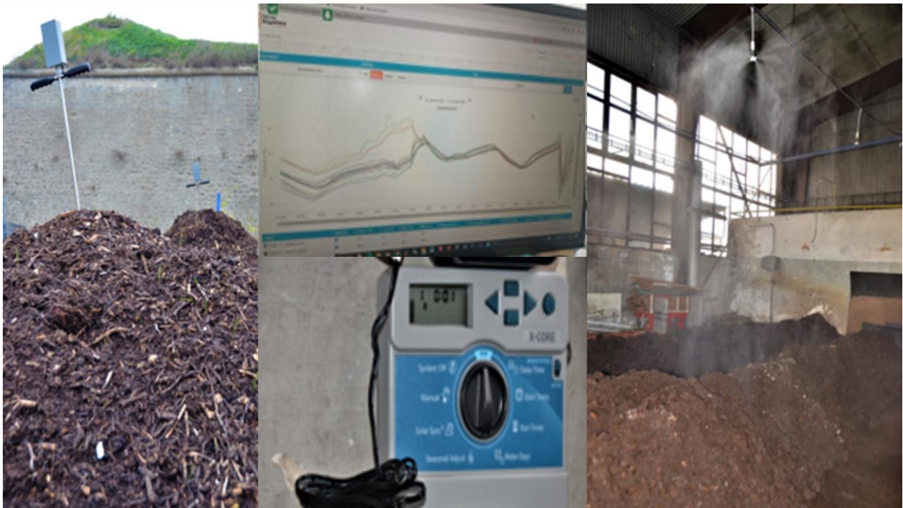
Foto 1: Systém na automatické zavlažovanie a meranie teploty kompostových kôp

RSP Živá Záhrada bol Trnavským samosprávnym krajom schválený grant na projekt Mikrobióm je život . Projekt spočíval v dobudovaní modelovej kompostárne ktorá produkuje biologicky kvalitný kompost a tekuté prípravky z neho s cieľom účinnej a rýchlej obnovy pôdy (intravilán extravilán). V rámci projektu bol vybudovaný automatický zavlažovací systém a zaobstarané automatické meranie teploty kompostových zakládok (Foto 1). Výška príspevku neumožnila renováciu priestorov a učebne.